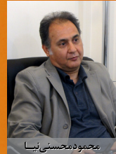
محمود محسنی نیا